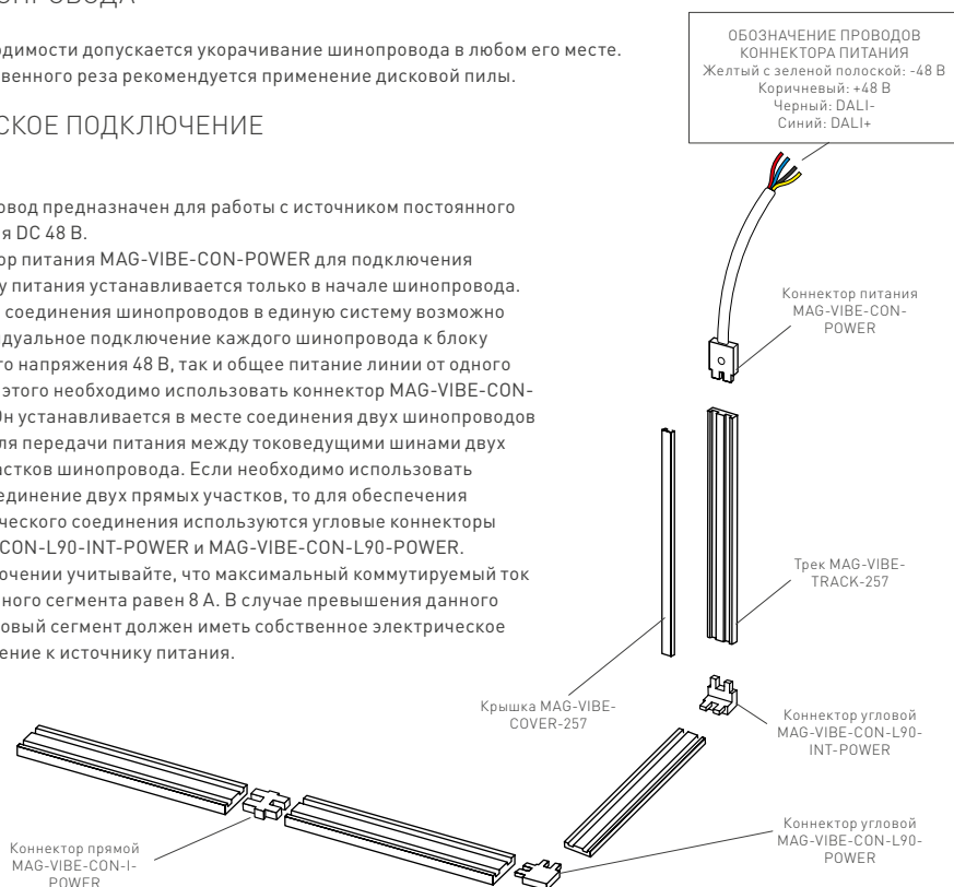
Рис. 2. Элементы и принцип построения разветвленной системы

При подключении учитывайте, что максимальный коммутируемый ток подключенного сегмента равен 8 А. В случае превышения данного значения новый сегмент должен иметь собственное электрическое присоединение к источнику питания.