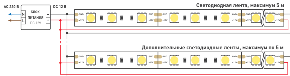
Схема 1. Подключение нескольких светодиодных лент с двух сторон